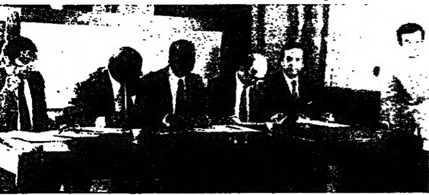
اجتماع اللجنة المشتركة أمس بحضور وزير المال